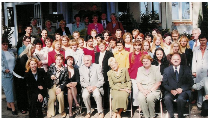
Uroczyste otwarcie nowej siedziby Stowarzyszenia (2002r.)