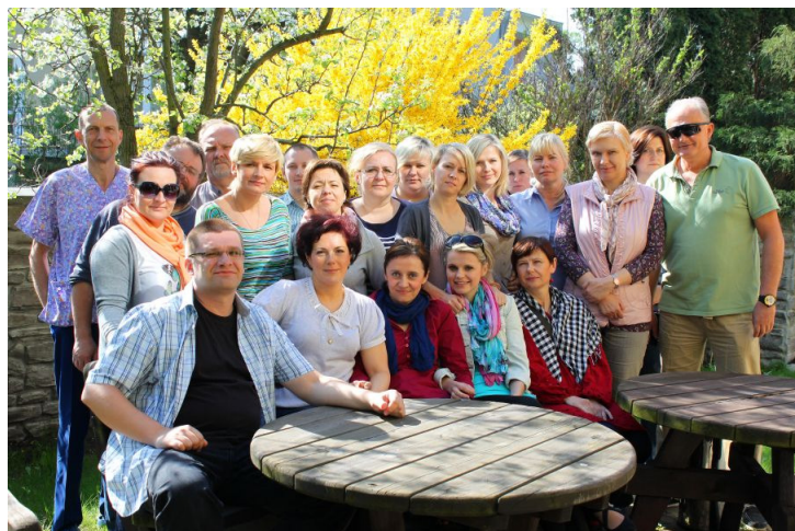
Zespół WHD, 2013 r.

Jako wiodący ośrodek pediatrycznej opieki paliatywnej w krajach Europy środkowo-wschodniej WHD odgrywa ważną rolę dla tego regionu, ale również dla innych krajów europejskich w szkoleniu teoretycznym i praktycznym lekarzy i pielęgniarek nabywających doświadczeń z tego zakresu, nawiązuje współpracę z działającymi ośrodkami i pomaga w organizacji zespołów domowych.